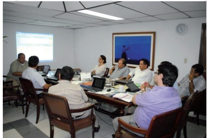
Oficina de Planeación Septiembre, 2013